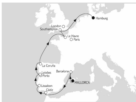
Mein Schiff 5