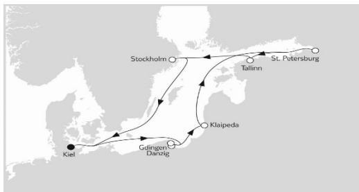
Mein Schiff 1 Ostsee mit Danzig 1